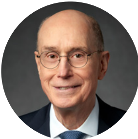
Na Rais Henry B. Eyring Mshauri wa Pili katika Urais wa Kwanza