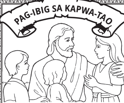
Ang dalisay na pag-ibig ni Cristo ay