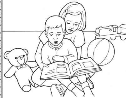
... hindi naghahangad para sa kanyang sarili.

Kulayan ang mga larawan, at gupitin ang mga hugis sa solidong itim na mga linya. Ituping lahat ang tuldok-tuldok na mga linya, at idikit o iteyp ang mga tab para makagawa ng isang cube. Ihagis ang cube at ibahagi kung paano mo maipapakita ang pag-ibig sa kapwa-tao sa paraan na nakalapag sa ibabaw. Kung ang salitang pag-ibig sa kapwa-tao ang nakalapag sa ibabaw, magbahagi ng isang paraan na nagpakita ng pagmamahal ang Tagapagligtas.