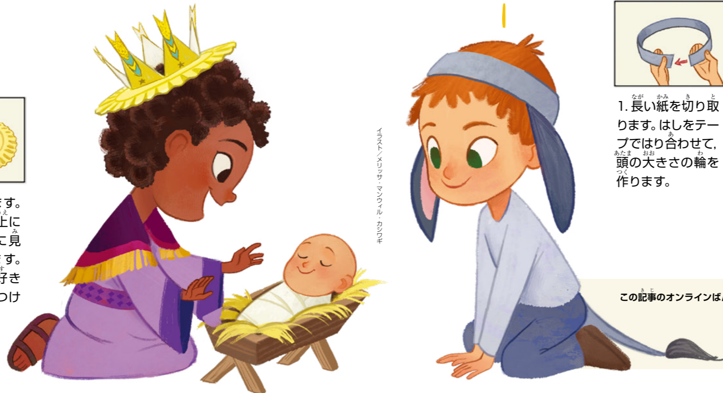
イラスト: マン・ワイル・カン・ロキ

この記事のオンラインばん (friend.ChurchofJesusChrist.org) で説明ビデオを見ることができます。