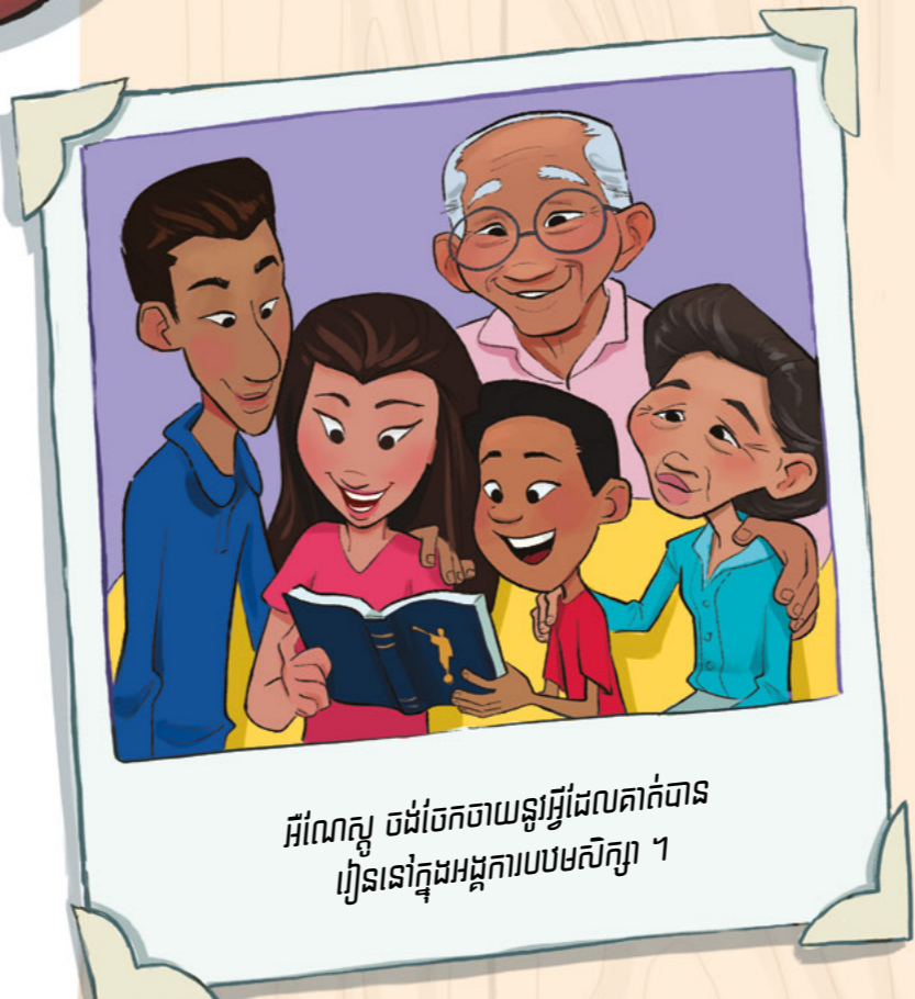
អីណែស្កូ ចង់ចែកចាយនូវអ្វីដែលគាត់បានរៀននៅក្នុងអង្គការបឋមសិក្សា ។