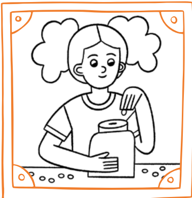
den Zehnten zahlen