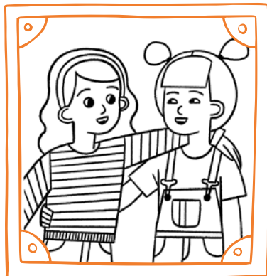
andere spüren lassen, dass sie willkommen sind

Konfirmierung: Nach der Taufe erhält man einen besonderen Priestertumssegens. Man wird so ein Mitglied der Kirche Jesu Christi und empfängt die Gabe des Heiligen Geistes.