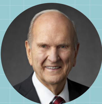
Av president Russell M. Nelson