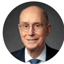
President Henry B. Eyring andre rådgivare i första presidentskapet