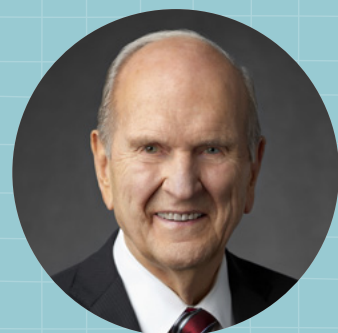
Președintele Russell M. Nelson