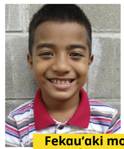
Fekau'aki mo Sikoti