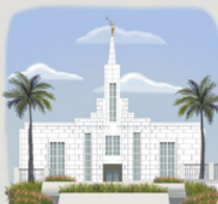
菲律賓很快就會 有八座聖殿。

菲力普知道天色越來越晚；鳥兒不再吱吱喳喳叫個不停，蟋蟀也開始大聲哼唱。他和母親已經在森林裡走了兩個多小時，但是他們走的每條路看起來都和之前的路一樣。他們完全迷路了。