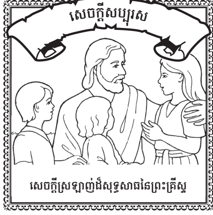
សេចក្តីស្រឡាញ់ដ៏សុទ្ធសាធនៃព្រះគ្រីស្ទ