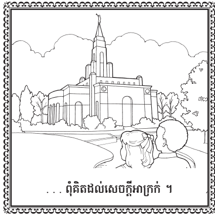
... ពុំគិតដល់សេចក្តីអាក្រក់ ។