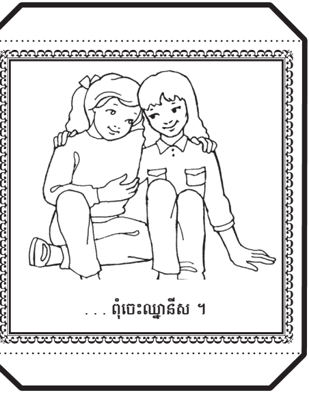
... ពុំចេះឈ្លានសី ។