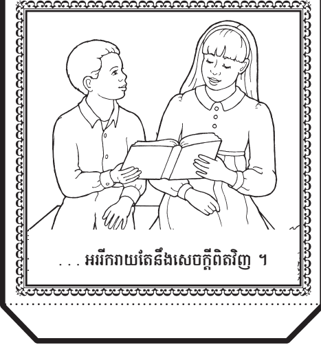
... អរីករាយតែនឹងសេចក្តីពិតវិញ ។