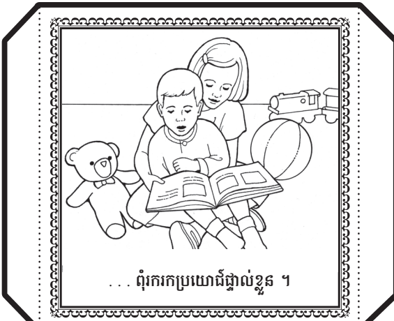
... ពុំរករបៀបយោងផ្ទាល់ខ្លួន ។

សូមដាត់ពណ៌រូបភាព ហើយប្រើកន្លែកកាត់ រូបចេញតាមខ្សែបន្ទាត់ខ្មៅជិត ។ សូមបត់ តាមបន្ទាត់ដាច់ៗទាំងអស់ ហើយបិតការ ឬ បិតស្កុតរូបទាំងអស់ធ្វើជារូបគូបមួយ ។ បោះ ដុំគូបនេះ ហើយចែកចាយពីរបៀបដែលអ្នក អាចបង្ហាញសេចក្តីសប្បុរស នៅក្នុងរបៀប ដែលបង្ហាញនៅផ្នែកខាងលើ ។ បើពាក្យ សេចក្តីសប្បុរស ត្រឡប់នៅលើ សូមចែកចាយ របៀបដែលព្រះអង្គសង្គ្រោះបានបង្ហាញសេចក្តី ស្រឡាញ់របស់ទ្រង់ ។