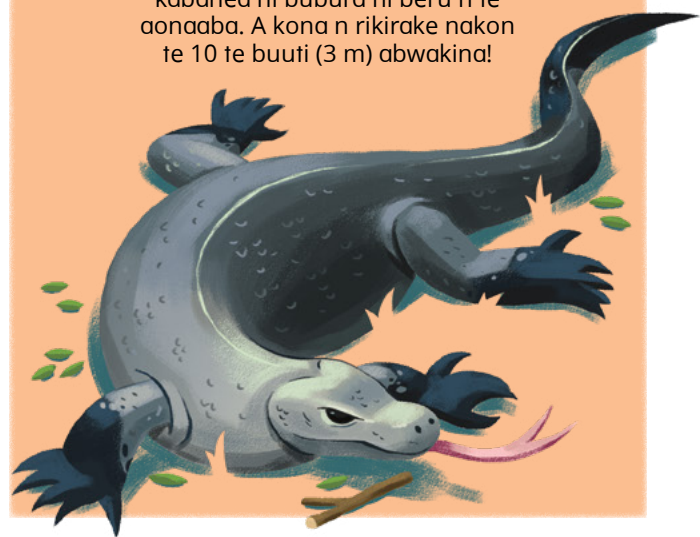
KAWATAA N TE TAMNEI IROUN CONNER GILLETTE

Te raakon ae Komodo bon te kabanea ni bubura ni beru n te aonaaba. A kona n rikirake nakon te 10 te buuti (3 m) abwakina!