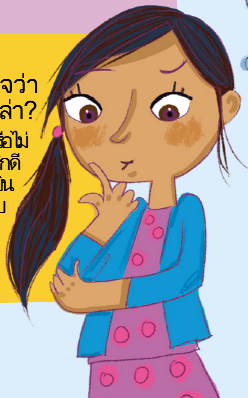
ภาพประกอบโดย แอนนาเฮล เบทเชสดี

บางครั้งหนูรู้สึกไม่แน่ใจว่หนู้รู้สึกถึงพระวิญญูญาณบริสุทธิ์หรือไม่ แต่ถ้าคุณลองคิดให้ดีขึ้นพระคัมภีร์และสวดอ้อนวอนและคุณรู้สึกดี เกี่ยวกับเรื่องนั้นคือความรู้สึกถึงพระวิญญูญาณบริสุทธิ์บางทีการได้ยิน พระวิญญูญาณบริสุทธิ์ไม่ได้มแค่ในรูปแบบความรู้สึกแต่ก็ในรูปแบบ ความคิดหรือแนวคิดได้เช่นกันหากคุณยังรู้สึกสับสนคุณสามารถ สวดอ้อนวอนขอความช่วยเหลือจากพระเจ้าอีกครั้งได้ตลอดเวลา