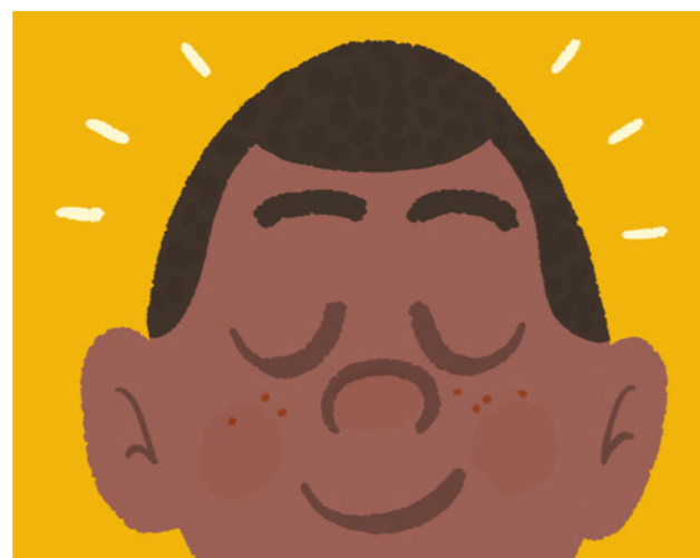
Jesús gaf okkur sakramentið af því að hann elskar okkur.