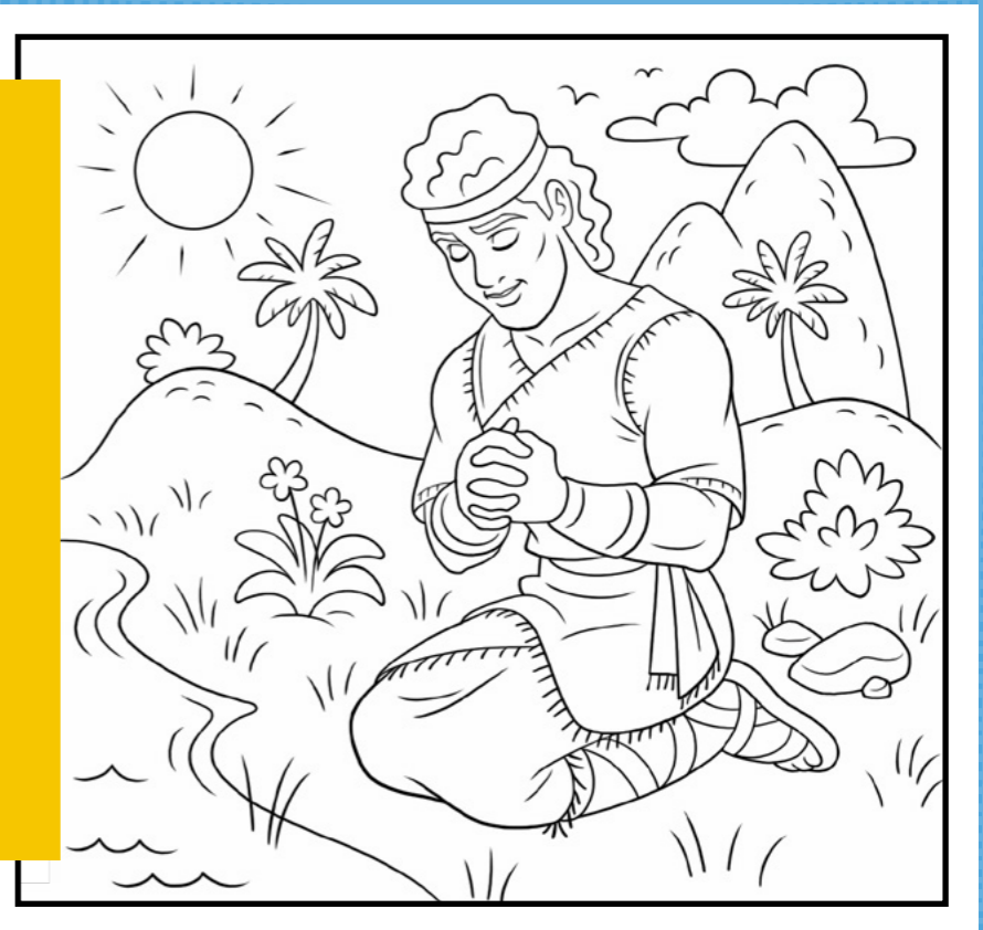
ILUSTRACE: JARED BECKSTRAND

Nakreslete nebo vytvořte něco, co bude ukazovat, jak vám Ježíš Kristus pomáhá. Fotografii svého výtvoru zašlete časopisu Kamarád! (Podívejte se na zadní obálku, ať víte jak.)