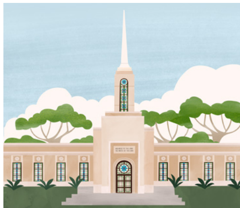
Նայրոբիի (Քենիա) տաճարը