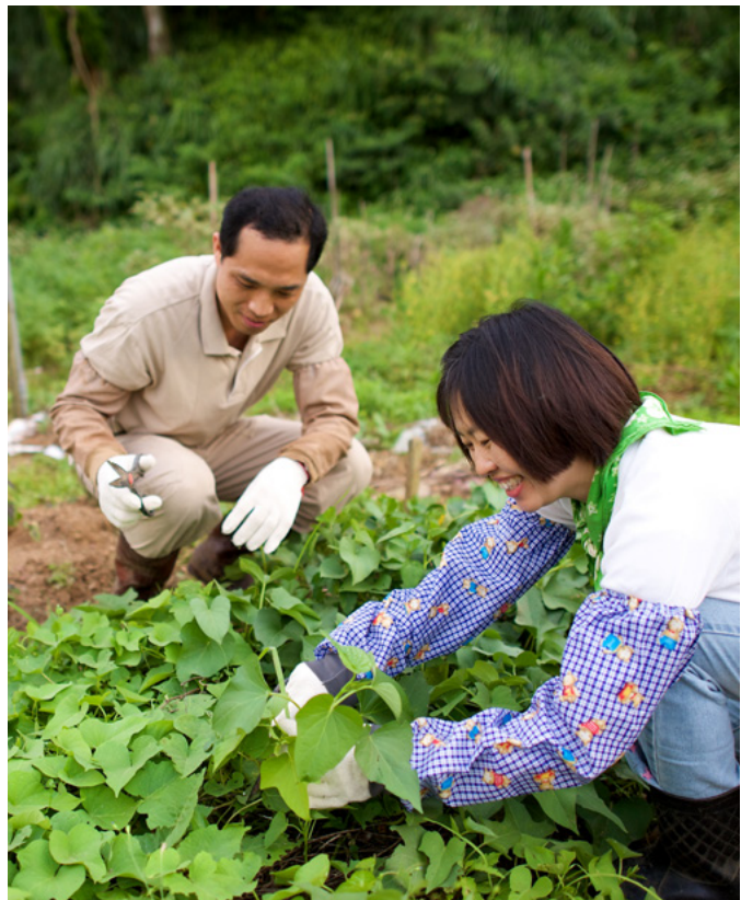
O se ulugalii o loo galulue i le la togalaau i Taiuani.