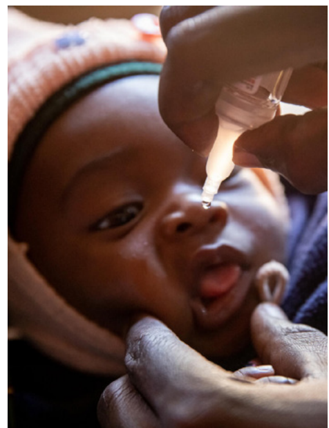
O se tagata taitasi soifua maloloina o loo faia se tui o le ma'i pipili mo se pepe i Zambia.

O lenei foai sa na o se tasi o nai foai na faia e le Ekalesia i le 2023, ua aafia ai le faitau afe o tagata taitoatasi i le salafa o le lalolagi.