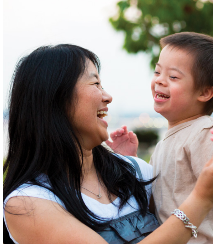
O tina o loo opoina a latou fanau.

921 galuega fesoasoani alofa e taulai atu i tamaitai ma tamaiti