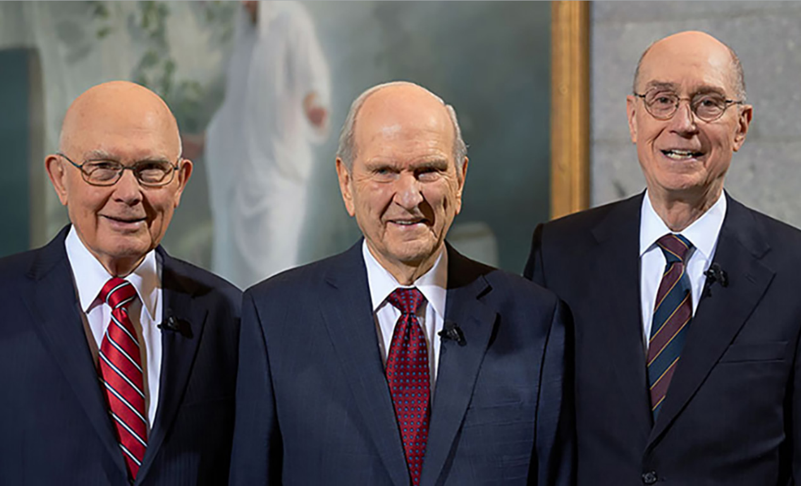
O Peresitene Russell M. Nelson ma ona fesoasoani e toalua, o Peresitene Dallin H. Oaks ma Peresitene Henry B. Eyring.