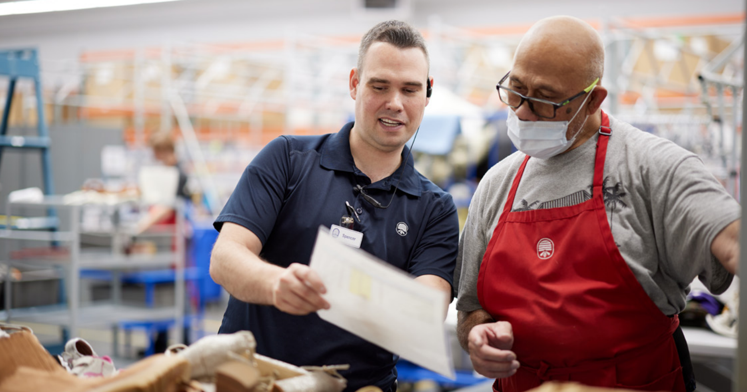
O loo fesoasoani se taitai galuega i se tagata fesoasoani a le Deseret Industries e faavasega aitema na foai atu.