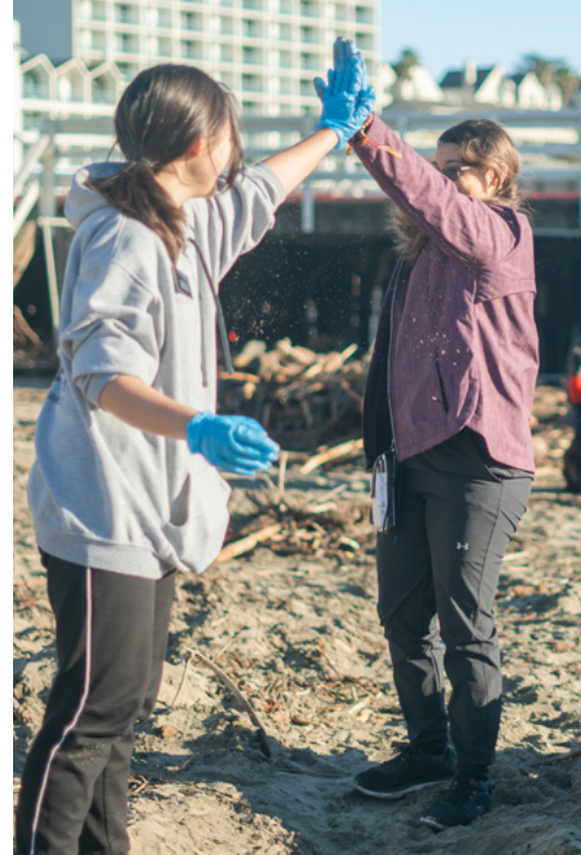
Agavale: O se tamaitiiti i Yemen ua faaunuuua mai lona fale o loo nofo i le pito i luga o anomea mo malutaga na foai atu. Ata mai le faaaloaloga a le ShelterBox. Taumatau: O volenitia o loo [po o latou lima] i le lima maualuga a o faamamaina otaota ina ua mavae se lolo i Kalefonia.