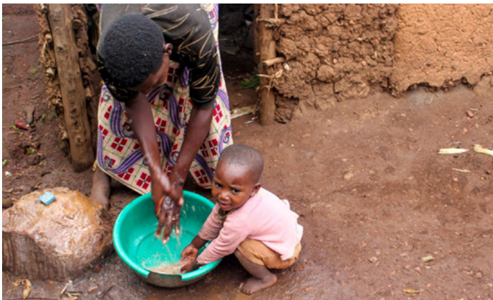
Agavale: O se tamaitai ma se teineitiiti o loo fufulu o laua lima. Ua fesoasoani se tamaitai i le tamateine a lana tama e inu vai mama mai le paipa i Timor-Leste.