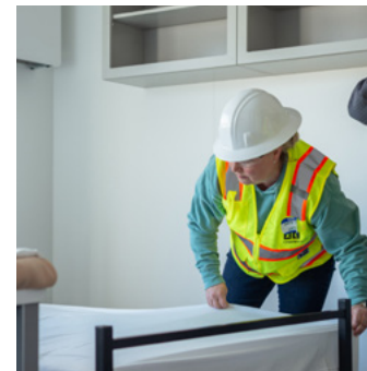
À gauche : Une famille déplacée en Syrie reçoit un kit d'hébergement et d'autres fournitures nécessaires. À droite : Des bénévoles locaux préparent des lits dans un refuge pour sans-abris en Californie.