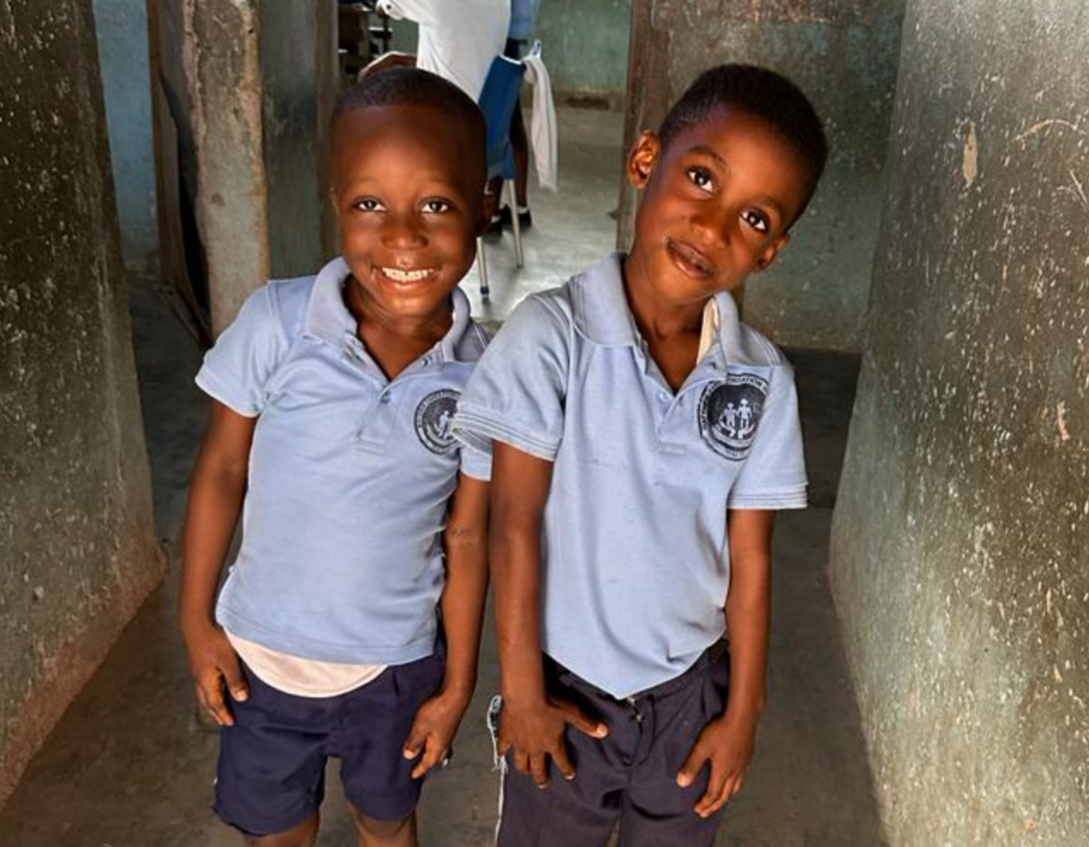
Des enfants sont instruits au sein d'un camp de réfugiés au Ghana.