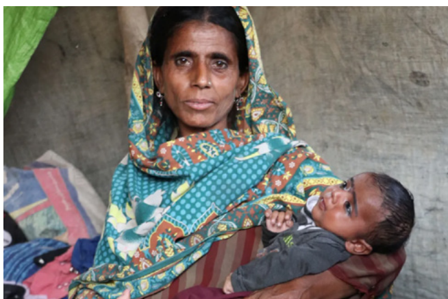
Une mère et son enfant habitent dans un abri temporaire suite à une inondation ayant détruit leur maison et leurs biens au Pakistan.

En mai, au Malawi, des milliers de personnes ont été déplacées quand la région a été touchée par un cyclone tropical qui a duré trente-six jours (le plus long jamais enregistré). En plus de fournir des tentes, des couvertures et du soutien aux centres médicaux mobiles, l'Église a aussi abrité des centaines de membres de la collectivité ayant perdu leur maison. Les membres de l'Église ont partagé leur nourriture avec ces personnes, organisé des voyages pour permettre à certaines de rejoindre des membres de leur famille et pris soin d'autres personnes jusqu'à ce qu'elles puissent trouver un logement convenable.