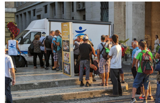
À gauche : Un groupe de réfugiés ukrainiens reçoit un soutien émotionnel de la part de conseillers. À droite : Des sans-abris à Rome font la queue pour recevoir de la nourriture et des vêtements.