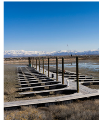
À gauche : Au Japon, une mère et ses enfants se déplacent ensemble à vélo. Au centre : Un jeune sœur missionnaire dévouée dédiée au service plante des fleurs autour du temple d'Ogden (Utah, États-Unis). À droite : Les pontons reposent sur un sol sec au Grand Lac Salé.