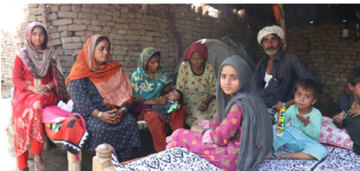
Au Pakistan, une famille se rassemble dans un abri après les inondations qui l'ont chassée de chez elle.