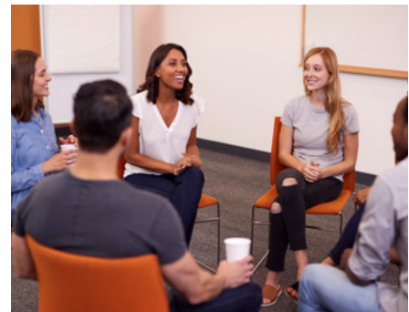
À gauche : Une jeune fille sourit en admirant la vue avec ses amies. Au centre : Réunion d'un groupe de traitement de la dépendance. À droite : Les membres de l'Église dirigent et participent à un cours de résilience émotionnelle.