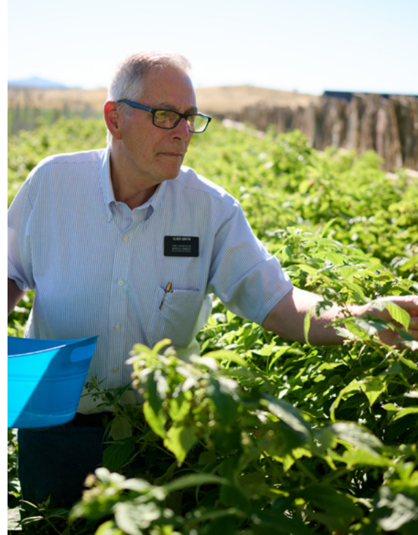
À gauche : À Haïti, un enfant savoure un repas équilibré à l'école. À droite : Un missionnaire d'âge mûr cueille des baies dans une ferme appartenant à l'Église.