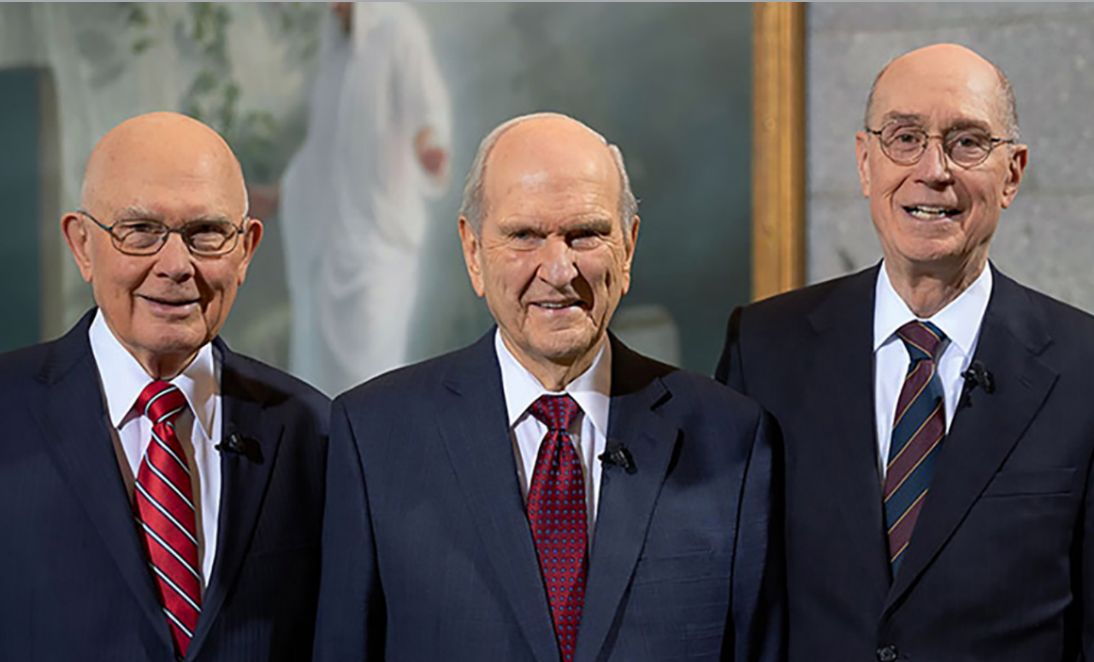
Russell M. Nelson, président de l'Église, avec ses deux conseillers, Dallin H. Oaks et Henry B. Eyring.