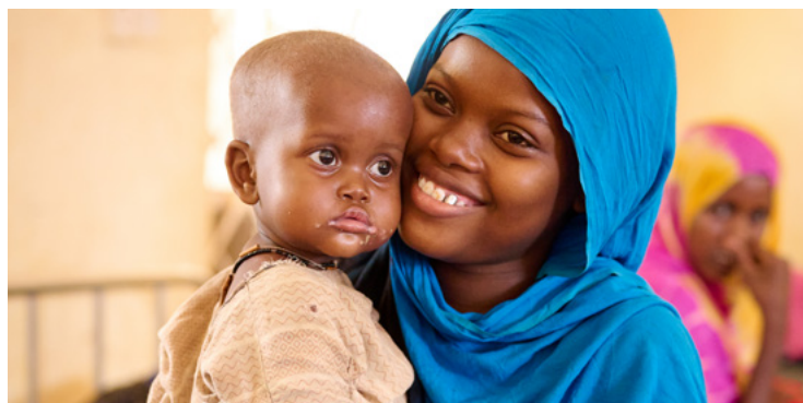
Une mère et son enfant reçoivent un abri et un soutien alimentaire au camp de réfugiés d'Ifo au Kenya.

À Hhohho, en Eswatini, l'Église et WaterAid ont uni leurs efforts pour fournir de l'eau potable à plus de 1 200 habitants de la collectivité. Le projet, incluant une étude hydrogéologique, comprenait la construction de deux systèmes d'eau à énergie solaire ainsi que la fourniture de la main d'œuvre et des machines nécessaires à sa réalisation.