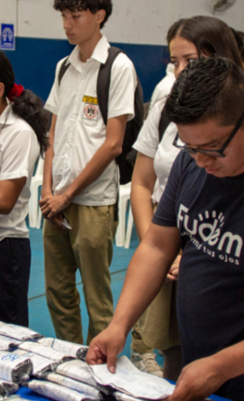
À gauche : Au Salvador, les élèves reçoivent des lunettes. À droite : Un homme participe au nettoyage après un incendie de forêt au Chili.