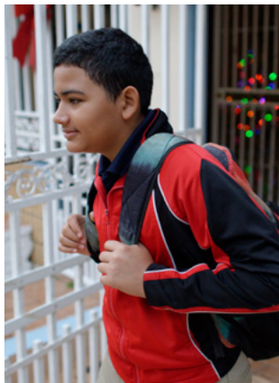
À gauche : Une classe EnglishConnect se réunit pour une leçon d'anglais. À droite : Un jeune homme en route pour l'école, à Porto Rico.