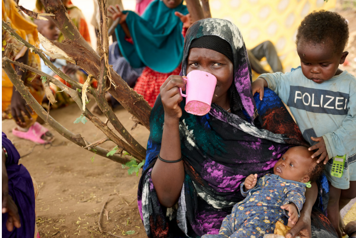
Une mère et un enfant reçoivent de la nourriture dans un camp de réfugiés au Kenya.