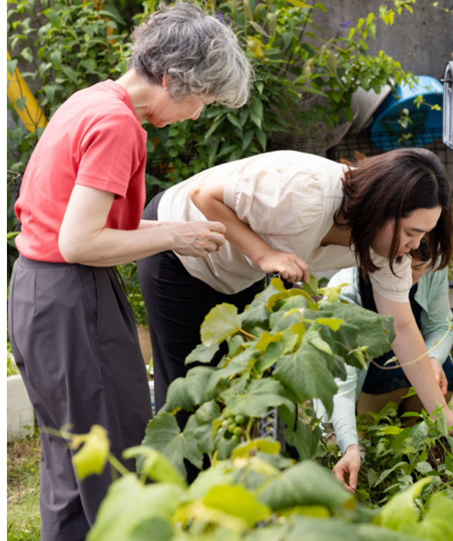
À gauche : En Argentine, des jeunes filles servent en aidant leurs voisins à faire leurs courses. À droite : Au Japon, des femmes s'occupent ensemble d'un jardin.