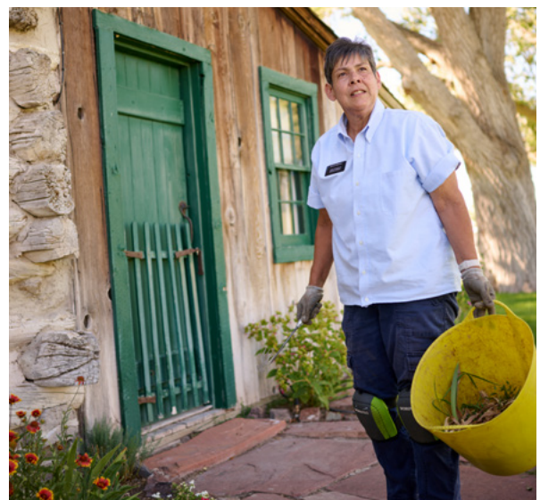
En haut : En France, des sœurs missionnaires aident une femme à emballer et à transporter des cartons. À gauche : Un missionnaire dédié au service apporte son aide au centre mondial de distribution de l'Église. En haut à droite : Des sœurs missionnaires d'âge mûr dirigent un programme en douze étapes auprès de femmes incarcérées. En bas à droite : Un missionnaire d'âge mûr rend service en participant à l'aménagement paysager à l'extérieur d'un site historique de l'Église en Utah.