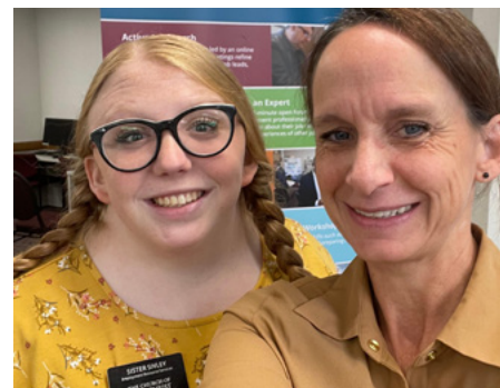
À gauche : Des demandeurs d'emploi se réunissent dans un centre d'aide à l'emploi pour assister à une réunion de groupe de recherche d'emploi active. Au centre : Au Mexique, un homme travaille dans un restaurant. À droite : Un jeune sœur missionnaire et un missionnaire d'âge mûr dédiés au service sont appelés à œuvrer au sein des services d'aide à l'emploi de l'Église.