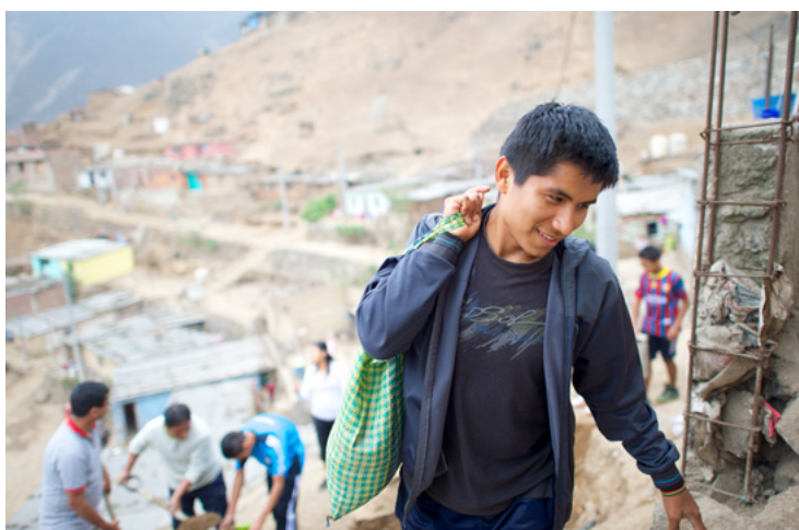
Un jeune homme participe à un projet de service au Pérou.