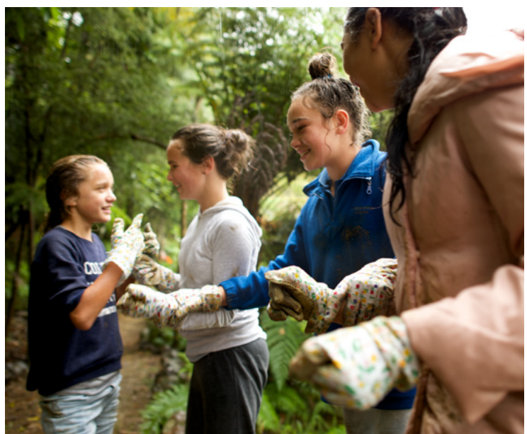
Des jeunes filles participent à un projet de service en Australie.