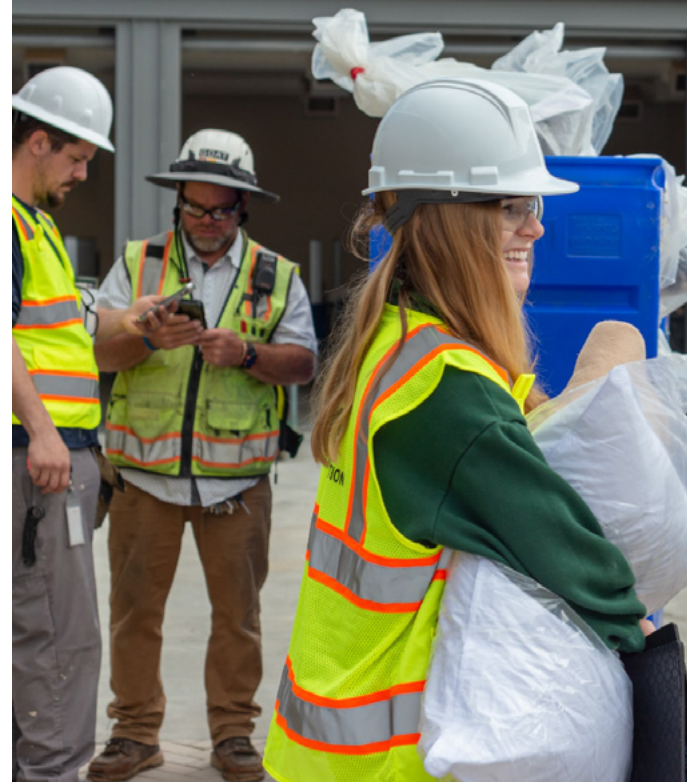
À gauche : Les dirigeants des Jeunes Gens chargent du bois au profit des personnes vivant dans des réserves amérindiennes aux États-Unis. À droite : Des bénévoles préparent un refuge pour sans-abris en Californie.

200 projets centrés sur l'aide aux femmes et aux enfants