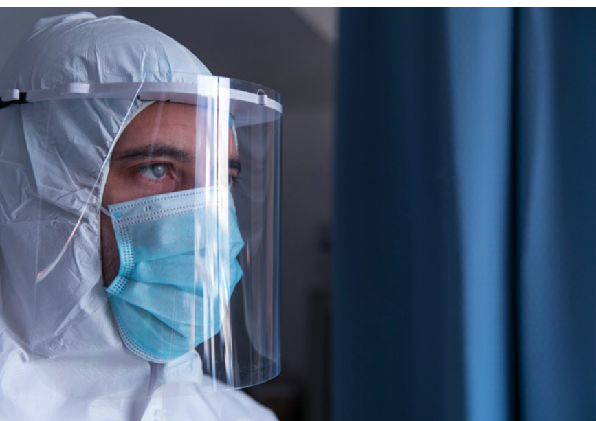
En République dominicaine, un chirurgien se prépare à réaliser une intervention médicale.