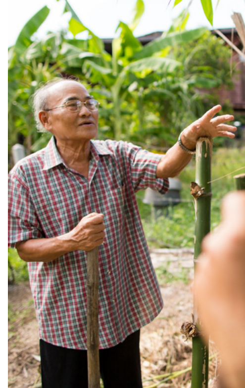
À gauche : Une famille reçoit des soins ophtalmologiques dans un centre de soins en Inde. À droite : Deux hommes en Thaïlande travaillent dans leur jardin.