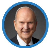
А. Президент Рассел М. Нельсон

«Родители, спасибо вам за все, что вы делаете для воспитания своих детей. И дети, спасибо вам за все, что вы делаете для воспитания своих родителей».