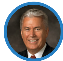
Б. Старейшина Дитер Ф. Ухтдорф