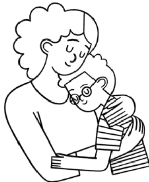
'Oku ou fai hoku lelei tahá ke fai ha ngaahi fili 'oku lelei mo tauhi e ngaahi fekau 'a e 'Otuá.

Fakalelei 'a Sisū Kalaisí: Ko e feilaulau na'e fakahoko 'e Sisū Kalaisi 'i he taimi na'á Ne mamahi ai mo pekia ma'atautolu pea toe tu'ú. Koe'uhí ko 'Ene Fakalelei, te tau toe mo'ui hili 'etau maté, pea 'oku tau lava foki 'o fakatomala.