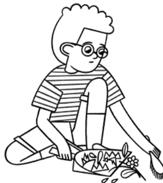
'Oku ou pehē "Fakamolemole" pea fai e me'a te u lavá ke fakalelei'i e me'a na'á ku faí.