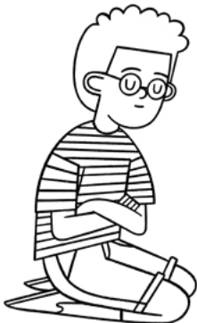
'Oku ou kole ki he Tamai Hēvaní ke Ne fakamolemole'i au.