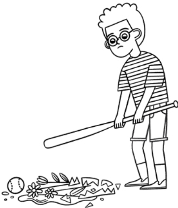
'Oku ou 'ilo ne u fai ha fili hala.