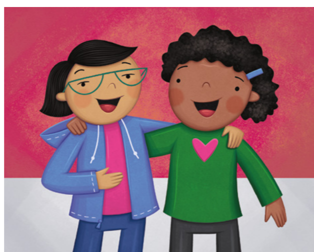
Я могу следовать за Иисусом, никого не обзывая.