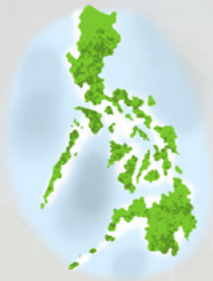
Ֆիլիպիններն ունի ավելի քան 7,600 կղզի: