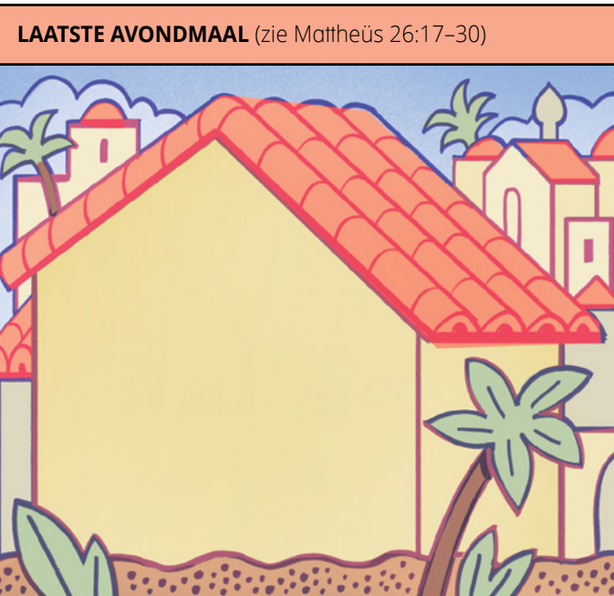
LAATSTE AVONDMAAL (zie Mattheüs 26:17-30)