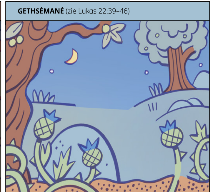
GETHSÉMANÉ (zie Lukas 22:39-46)