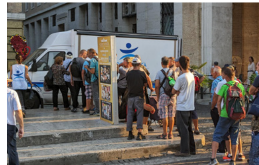
To’ohemá: ‘Oku ma’u ‘e ha kulupu kumi hūfanga mei ‘Iukuleini ha tokoni fakaeloto mei he kau faifale’i. Faka’aonga’i ‘o e taá ‘i he angalelei ‘a e MEDU. To’omata’ú: ‘Oku tu’u laine ‘a e ni’ihi fakafo’ituitui ‘oku nau fehanganagai mo e tukuhausiá ‘i Lomá ke ma’u ha me’akai mo ha vala. Faka’aonga’i ‘o e taá ‘i he angalelei ‘a e Progetto Arca.