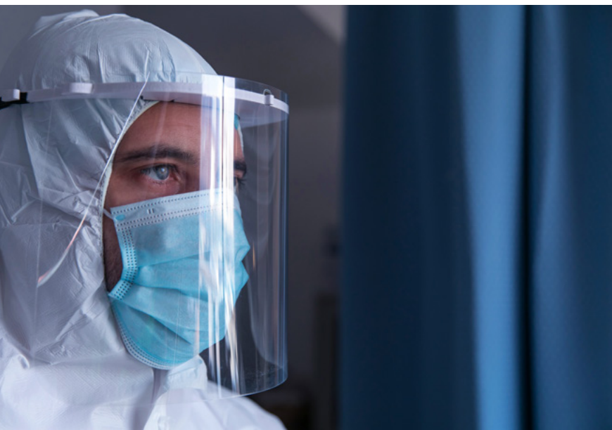
Ko e teuteu ha toketā faitafa 'i he Lepapulika Tominikení ke fakahoko ha tafa fakafaito'o.