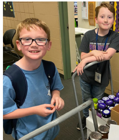
To'ohemá: 'Oku kau 'a e hou'eiki fafine mei ha ngaahi kulupu tui fakalotu kehekehe 'i ha ngāue JustServe 'i honau koló. To'omata'ú: Na'e tñnaki 'e 'Ēvani mo hono kaungāakó ha 'ū hina siamu mo e seli 'i he akó.