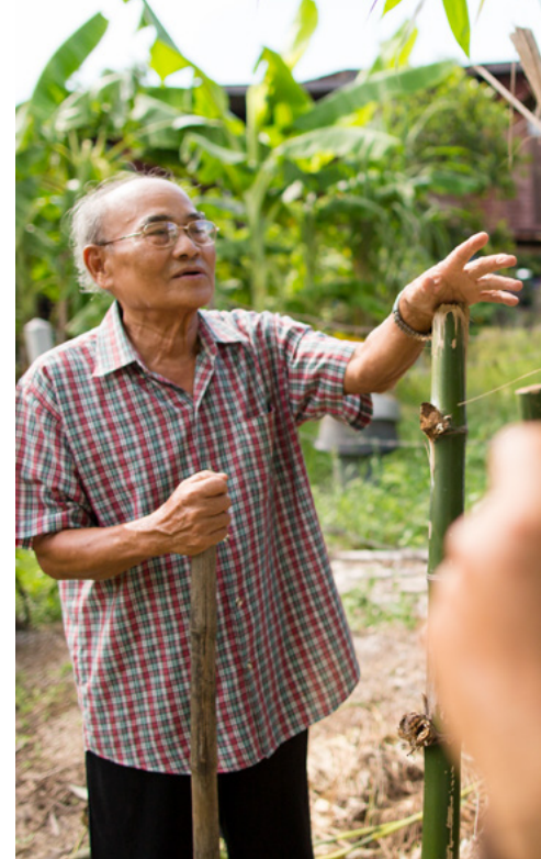
To'ohemá: 'Oku ma'u 'e ha fāmilī ha tokoni ki he'enau sió 'i ha senitā tokangaekina 'o e matá 'i 'Initia. To'omata'ú: Ko e ngāue ha ongo tangata 'i Taileni 'i he'ena ngoué.

Ngaahi polōseki tokoni 'ofa fakaetangata 'e 305