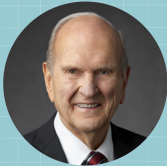
Fai 'e Palesiteni Russell M. Nelson