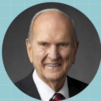
Präsident Russell M. Nelson