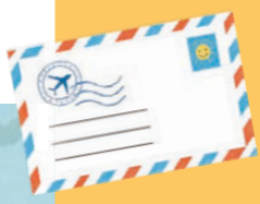
ภาพประกอบโดย สติลเลียนา โดนา

ท่านติดตามพระเยซูได้เช่นกัน! มีหลายวิธีให้ติดตามพระเยซู ท่านติดตามพระองค์อย่างไร? เขียนบอกเรา!