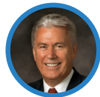
B. Élder Dieter F. Uchtdorf