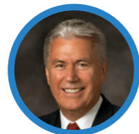
B. Dieter F. Uchtdorf elder