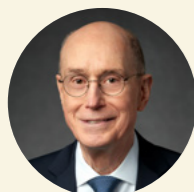
Saunia e Peresitene Henry B. Eyring Fesoasoani Lua i le Au Peresitene Sili

FOEULI: o se uili po o se teetatau e uli ai se vaa