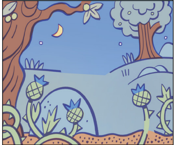
KUVTIUS JOSH TALBOT