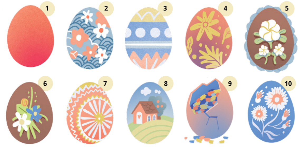
Vastaukset ovat sivulla 30.