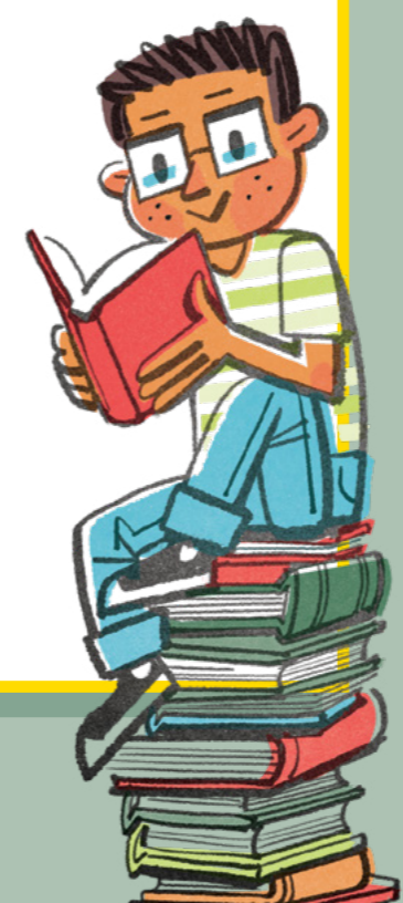
ILLUSTRATIONER: JOSH TALBOT