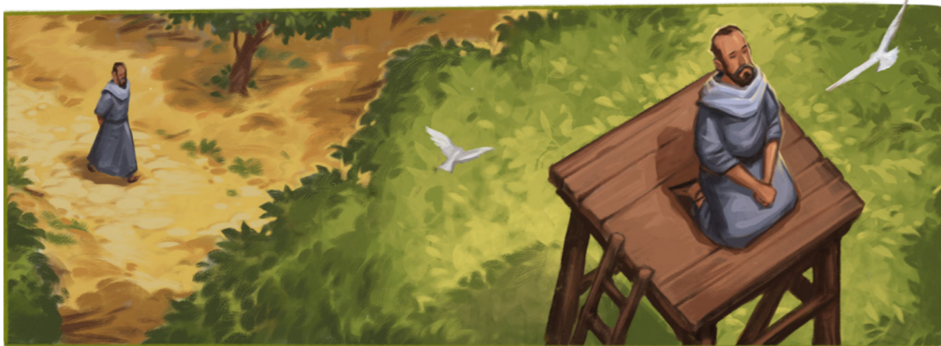
Nankao amin'ny sahan'ny i Nefia. Nihanika teny amin'ny tilikambo iray tao amin'ny sahan'ny izy ary nivavaka tamin' Andriamanitra teny. Nivavaka ho an'ny olona izy.