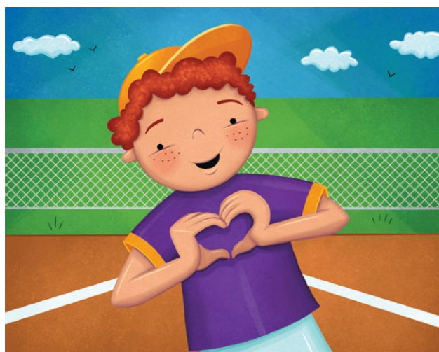
예수님은 모든 사람을 존중하세요! 나도 예수님처럼 친절할 수 있어요.