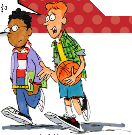
วาด แซตวีก เบ็กส์

วันหนึ่งผมจะค้นหา นิยามของคำว่า การผัดวันประกันพรุ่ง