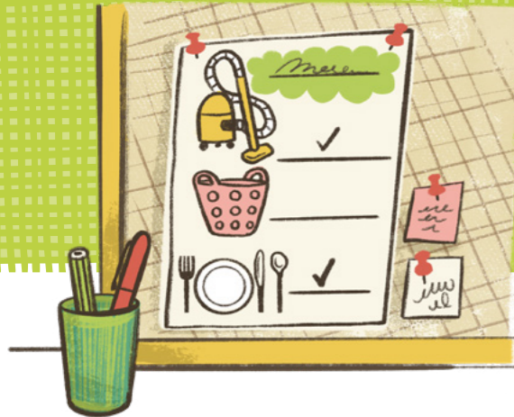
25 Nōvema–1 Tisema

Ki he efiāfi 'i 'apí pe ako folofolá—pe ke ma'u pē ha fiefia!