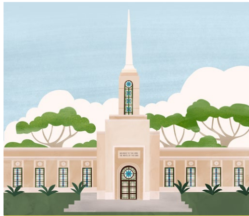
케냐 나이로비 성전