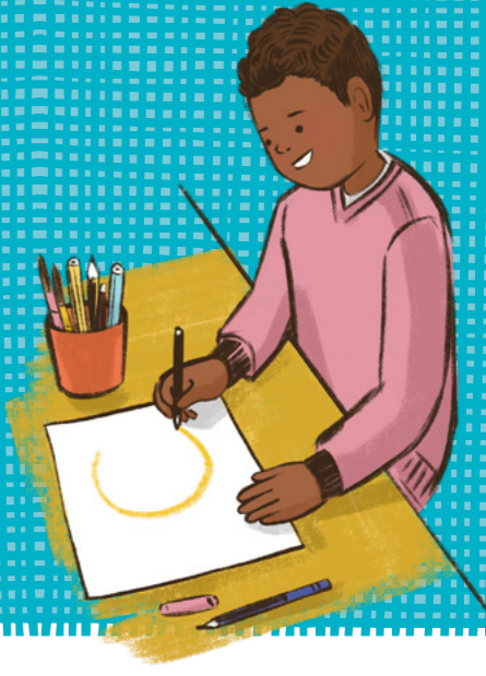
ថ្ងៃទី ២៣-២៩ ខែ កញ្ញា

សម្រាប់កុមារតូចៗ ៖ លេងល្បែងបិទពួន ជាមួយកុមារតូចៗរបស់អ្នក ។ សូមឱបពួកគេខ្លាំងៗពេលប្អូនឃើញពួកគេ ។ ចូរនិយាយអំពីរបៀបដែលព្រះយេស៊ូគ្រីស្ទសន្យាថាទ្រង់នឹងប្រមូលយើងដូចយើងនៅទីណាទេ ។