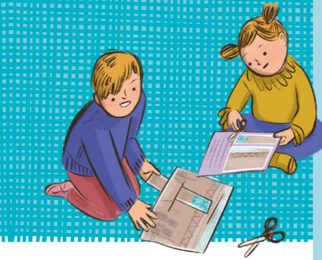
ថ្ងៃទី ៩-១៥ ខែ កញ្ញា

សម្រាប់កុមារតូចៗ ៖ សូមសួរកុមារតូចៗរបស់អ្នកអំពីអ្វីដែលពួកគេស្រឡាញ់អំពីព្រះយេស៊ូគ្រីស្ទ ។ បន្ទាប់មក សូមចែកចាយទីបន្ទាល់របស់ប្អូនអំពីព្រះអង្គសង្គ្រោះជាមួយពួកគេ ។