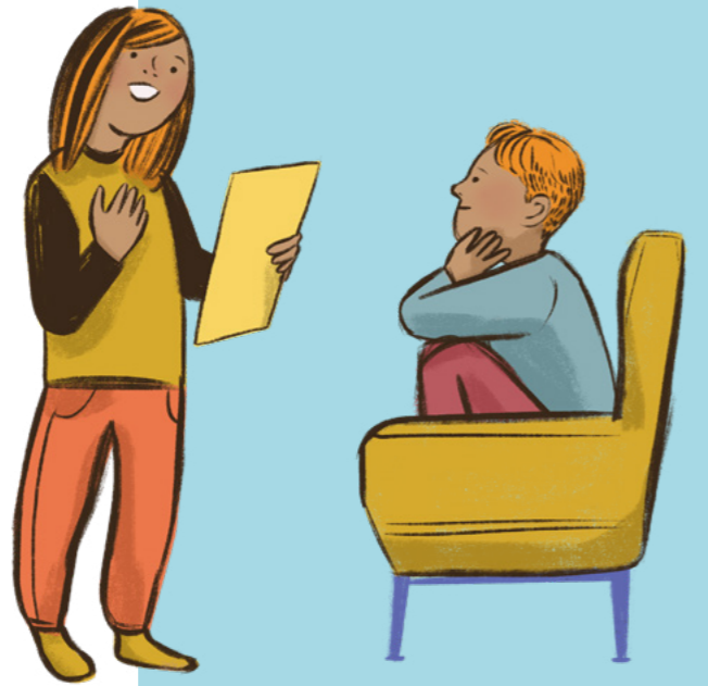
ថ្ងៃទី ២-៨ ខែ កញ្ញា

សម្រាប់កុមារតូចៗ ៖ ជួយកុមារតូចៗរបស់អ្នកស្វែងរកអ្វីដែលពួកគេគិតថាពិតជាវង់មាំខ្លាំង ។ តើពួកគេឃើញអ្វីខ្លះ ? ចូរបង្រៀនថាយើងអាចមានភាពវង់មាំជាមួយនឹងព្រះយេស៊ូគ្រីស្ទ ។