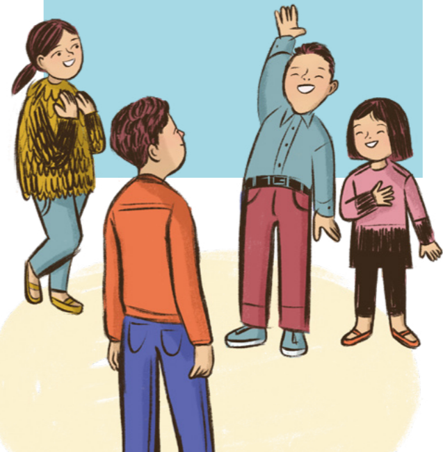
ថ្ងៃទី ១៦-២២ ខែ កញ្ញា

សម្រាប់កុមារតូចៗ ៖ សូមកាន់កុមារតូចៗរបស់ប្អូនខណៈដែលពួកគេឈរលើកៅអី ហើយចែកចាយនូវអ្វីដែលពួកគេដឹងអំពីព្រះយេស៊ូគ្រីស្ទ ដូចជាសំយូរអែលបានធ្វើ ។