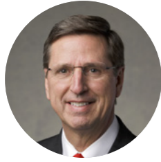
Iroun Uniwmaane Kevin W. Pearson Man te Itingaun