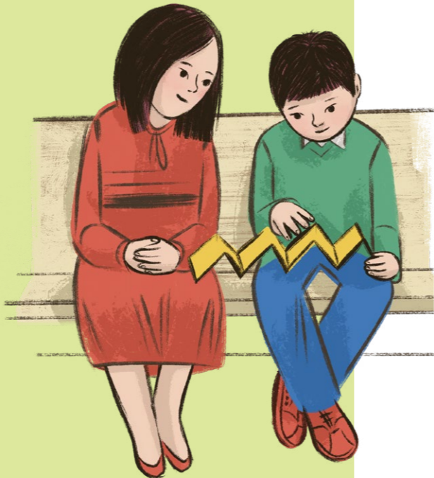
삽화: 케이티 도크릴

나이가 어린 어린이: 자녀와 함께 44쪽을 펴서 우리가 예수님을 기억함으로써 어떻게 그분을 따를 수 있는지에 대해 읽어 보세요.