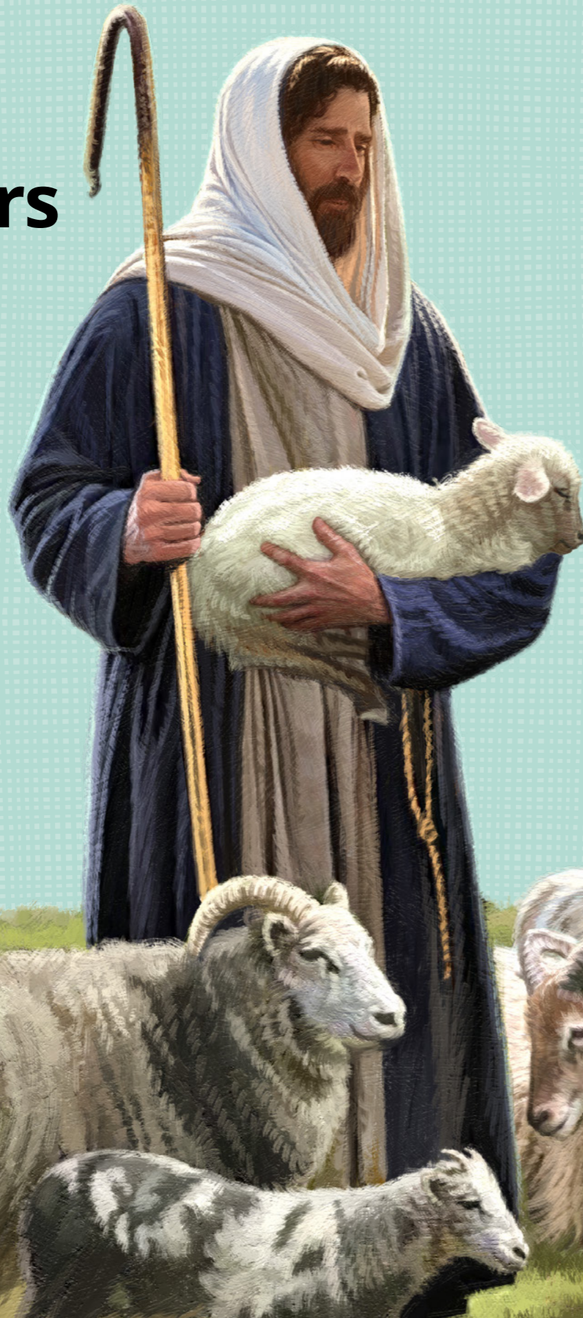
LÖSUNG: JESUS CHRISTUS, VOM HEILIGEN GEST, NACH SEINEM NAMEN (CHRISTUS)

Jesus Christus wird auch guter Hirte genannt. Wir sind sozusagen seine Schafe. Er wacht über uns und führt uns. Im Neuen Testament sagt Jesus, dass er „andere Schafe“ hat, die in einem anderen Teil der Welt leben (Johannes 10:16). Nach seiner Auferstehung erschien er einigen dieser Menschen im alten Amerika. Er segnete sie. Er heilte sie und unterwies sie. Er liebte sie genauso wie die Menschen in Jerusalem. Jesus hat Schafe in aller Welt. Er liebt alle Kinder des himmlischen Vaters, wo sie auch leben mögen. Er liebt dich! ●