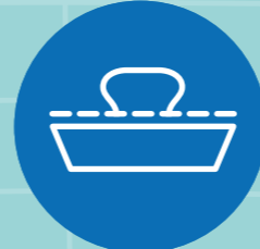
ធ្វើ ហើយរក្សាសេចក្តីសញ្ញា