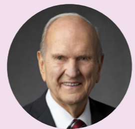
ប្រធាន វិសុល អ៊ឹម ណិលសុន