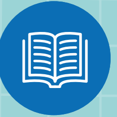
រៀនអំពីព្រះយេស៊ូវគ្រីស្ទ និងដង្ហាយធូនរបស់ទ្រង់