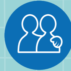
ជួយនាំមនុស្សដទៃទៅ រកព្រះយេស៊ូវគ្រីស្ទ