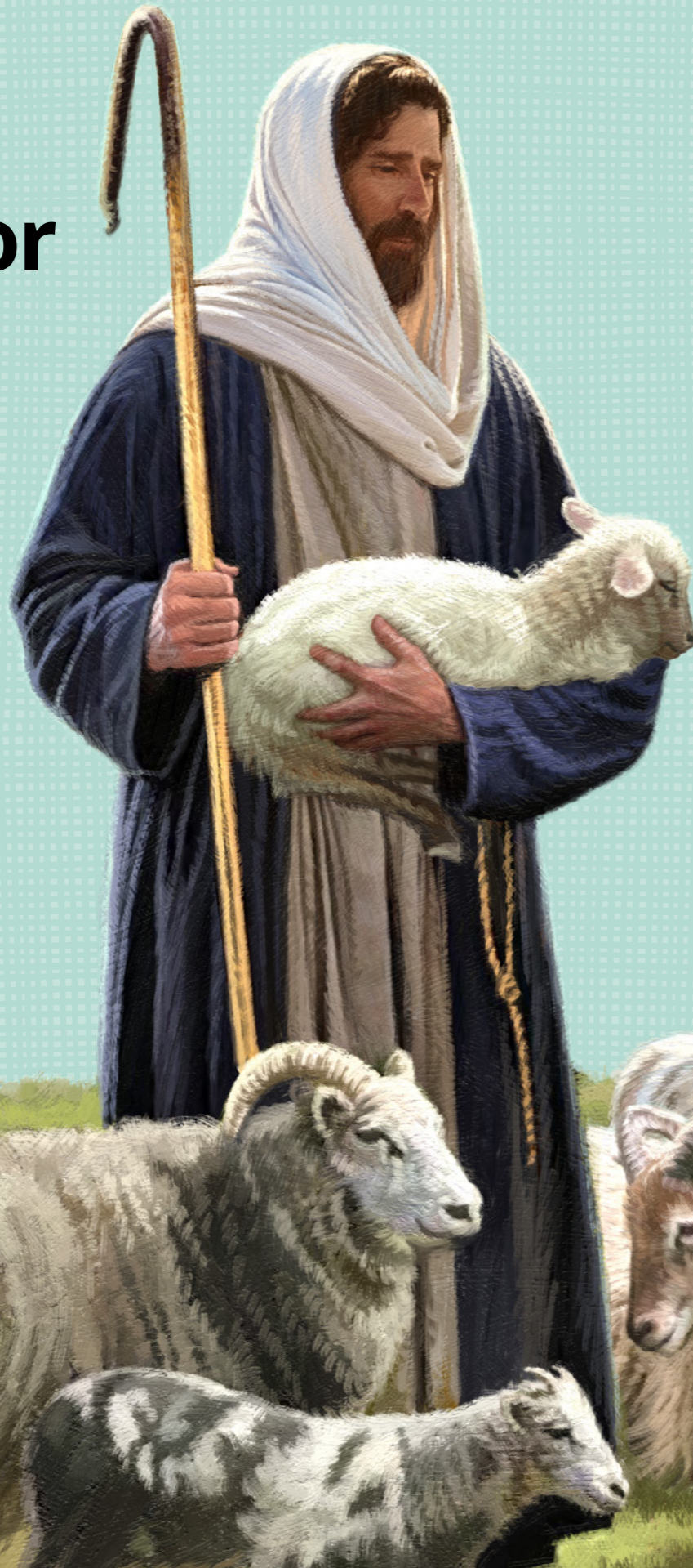
RESPUESTAS: JESUCRISTO; EL ESPÍRITU SANTO; SU NOMBRE (CRISTO)

A Jesucristo se lo llama el Buen Pastor, y nosotros somos como Sus ovejas. Él nos cuida y nos guía. En el Nuevo Testamento, Jesús enseñó que tenía "otras ovejas" que vivían en otra parte del mundo (Juan 10:16). Después de resucitar visitó a algunas de esas otras personas en las Américas, las bendijo, las sanó y les enseñó. Él las amaba tanto como a las personas de Jerusalén. Jesús tiene otras ovejas en todo el mundo y ama a todos los hijos del Padre Celestial sin importar dónde vivan. ¡Él te ama! ●