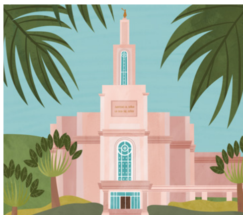
Templet i Santo Domingo i Den Dominikanske Republik