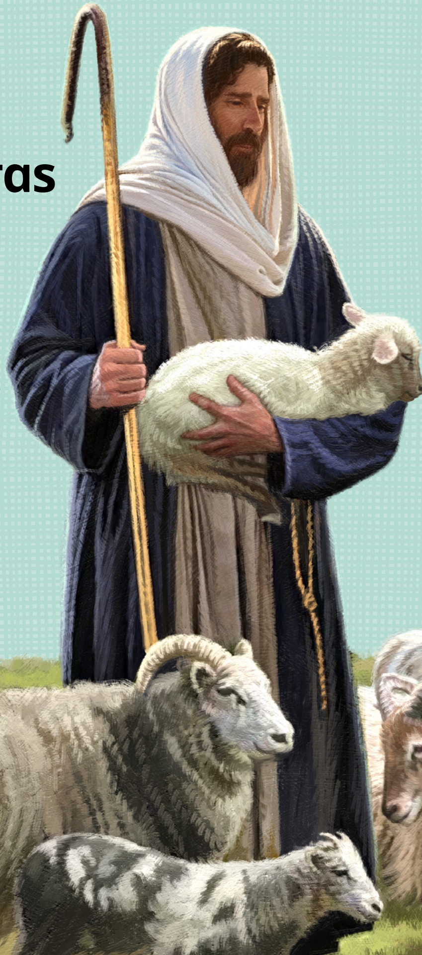
MGA SAGOT: HAYAN ITONG MAGLIWANAG; NG ESPIRITU SANTO; SA KANYANG PANGALAN (CRISTO)

Si Jesucristo ang tinatawag na Mabuting Pastol. Tayo ay katulad ng Kanyang mga tupa. Binabantayan at ginagabayan Niya tayo. Sa Bagong Tipan, itinuro ni Jesus na Siya ay may "ibang mga tupa" na nakatira sa ibang dako ng mundo (Juan 10:16). Matapos Siyang mabuhay na mag-uli, binisita Niya ang ilan sa mga taong iyon sa mga lupain ng Amerika. Binasbasan Niya sila. Pinagaling at tinuruan Niya sila. Minahal Niya sila tulad ng pagmamahal Niya sa mga tao sa Jerusalem. Si Jesus ay may iba pang mga tupa sa buong mundo. Mahal Niya ang lahat ng mga anak ng Ama sa Langit saanman sila nakatira. Mahal Niya kayo! ●