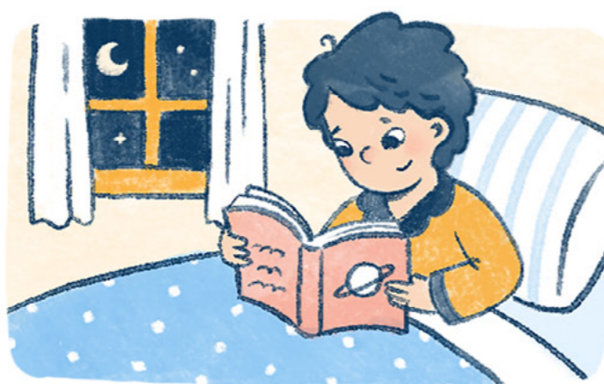
Gabi-gabi ay iyon at iyon ding kuwento ang binabasa niya bago matulog.