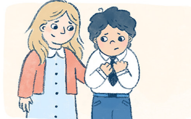
Tumayo sa tabi niya ang kanyang kaibigan para pagaanin ang pakiramdam niya.