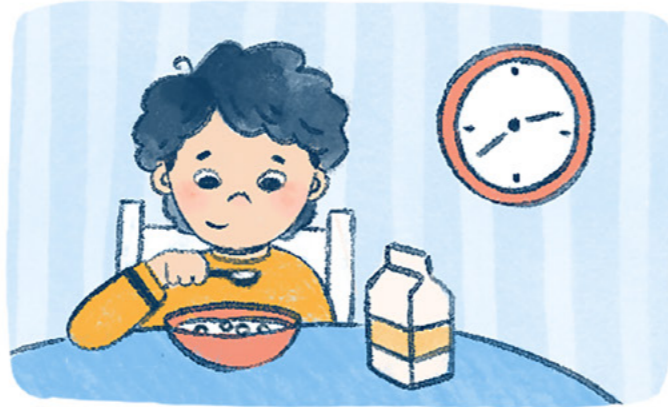
Para kay Zack, ang ibig sabihin niya ay ayaw niya ng ingay. At gusto niyang pare-parehong mga bagay ang gawin niya araw-araw.