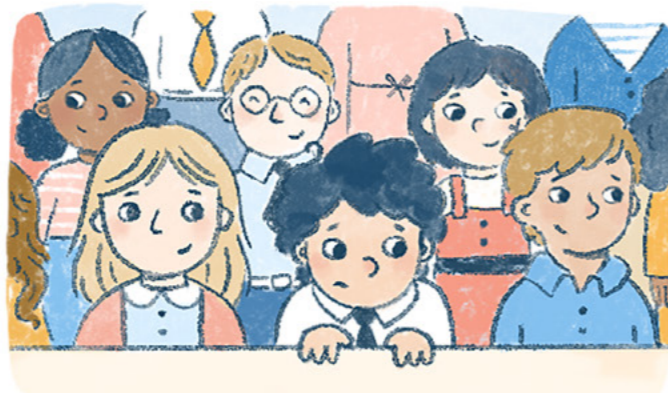
Isang araw sa simbahan, nagpraktis ang lahat ng bata para sa programa ng Primary sa chapel. Ibang-iba ito!