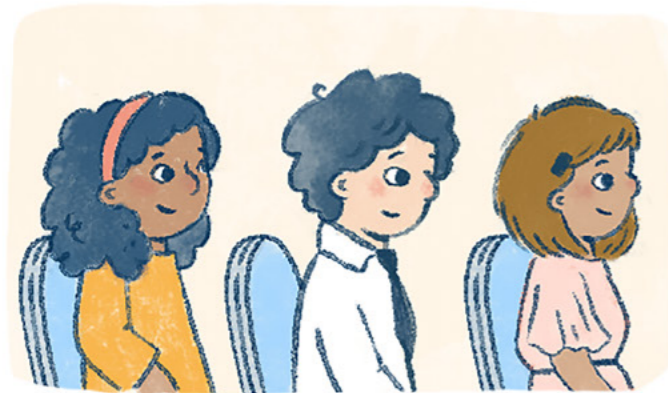
At tuwing Linggo ay iyon at iyon ding silya ang inuupuan niya sa Primary.