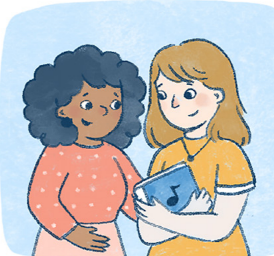
At may naisip na ideya ang music director at ang Primary president.