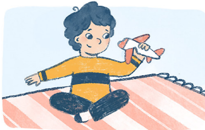
Tuwing hapon ay iyon at iyon ding laruang eroplano ang nilalaro niya.