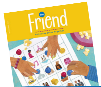
ภาพประกอบโดย วรุณ แกมดอนต์

เคนยาเป็นบ้านของนักวิ่งระดับโลกที่เก่งที่สุดในโลกหลายคน พวกเขาได้รับรางวัล 106 เหรียญจากการแข่งขันวิ่งในโอลิมปิก