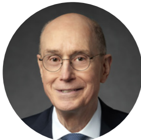
President Henry B. Eyring Tweede raadgever in het Eerste Presidium