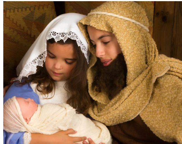
나는 성탄절에 그분의 탄생을 축하할 수 있어요.