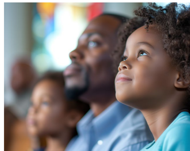
나는 항상 예수님을 기억하려고 노력할 수 있어요.