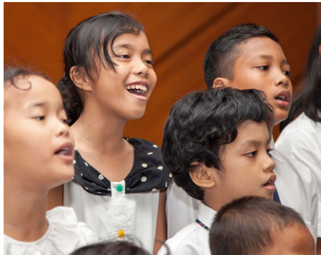
나는 초등학교에서 예수 그리스도에 대해 배우고 노래를 부를 수 있어요.