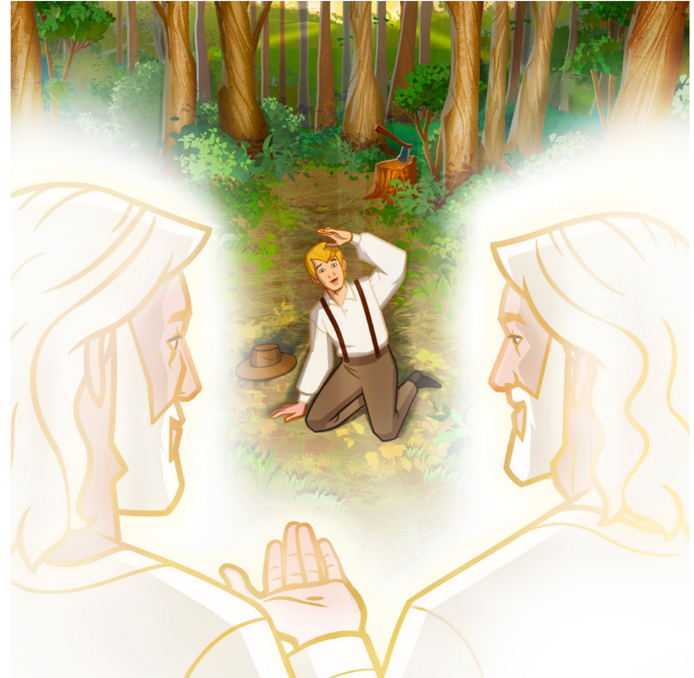
De repente, José vio una luz brillante que descendía del cielo y vio al Padre Celestial y a Jesucristo de pie en el aire. El Padre Celestial pronunció el nombre de José. Entonces, Él señaló a Jesucristo y dijo: “Este es mi Hijo Amado: ¡Escúchalo!”.