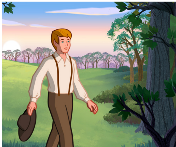
En un hermoso día de primavera, José fue al bosque a orar al Padre Celestial.